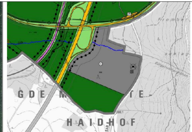
Ausschnitt- Entwurf des Flächennutzungsplans, o.M.

Bewertung der Eingriffserheblichkeit laut Entwurf Flächennutzungsplan (Sept. 2019):